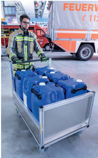
Abb. Bestell-Nr. 120911